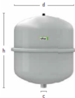
N 8 – 25 litres