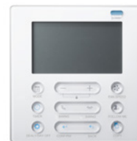
Langallinen säädin (CHP484) optiona