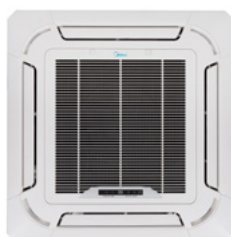
Kehysritilä (CHP482) on pakollinen lisävaruste.